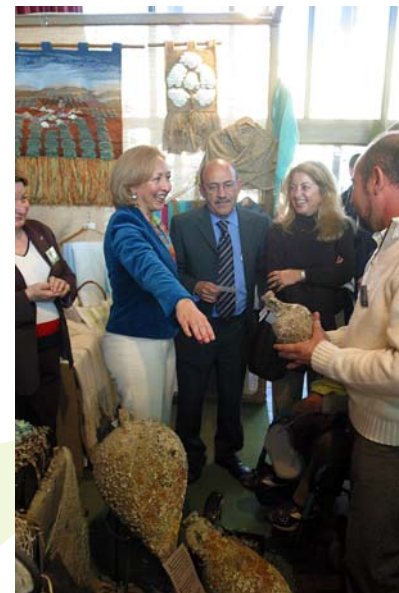
I FERIA MARCA 2004